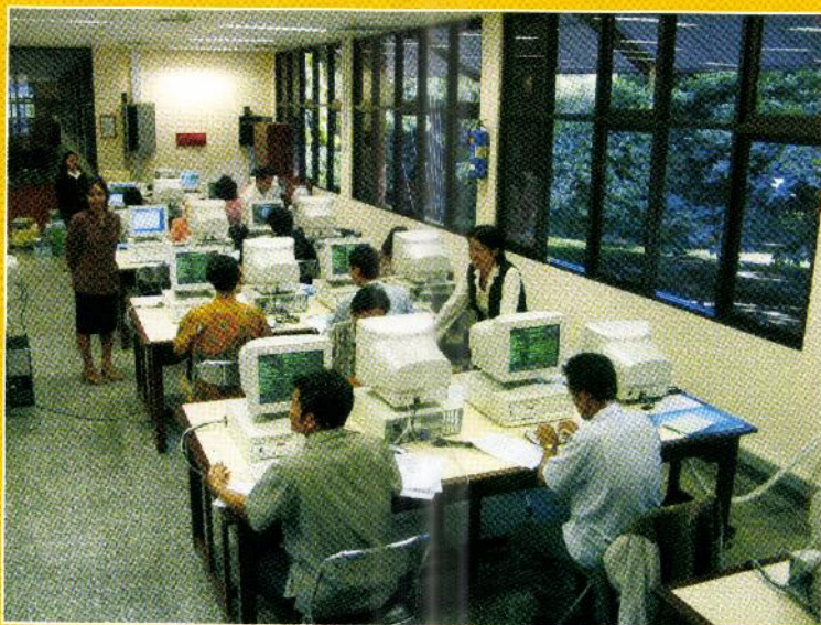
Sesi pengelolaan terbitan berkala