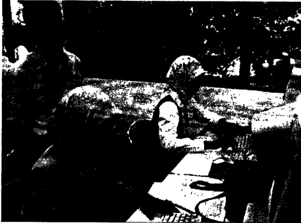
Salah satu sesi otomasi komputer

Pelatihan pengelolaan perpustakaan sekolah yang memang sudah merupakan salah satu rencana strategis perpustakaan, tahun ini telah memasuki tahun ke-2. Untuk kali ini, pelatihan dilaksanakan selama satu bulan penuh dengan materi yang lebih padat dan beragam.