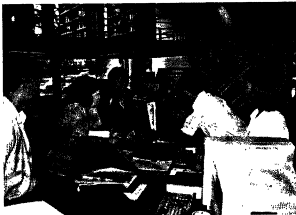
Kunjungan ke perpustakaan Universitas Bina Nusantara

susnya pengadaan, pengolahan, dan pelayanan dengan program pengelolaan perpustakaan. Bahkan di antaranya telah me-