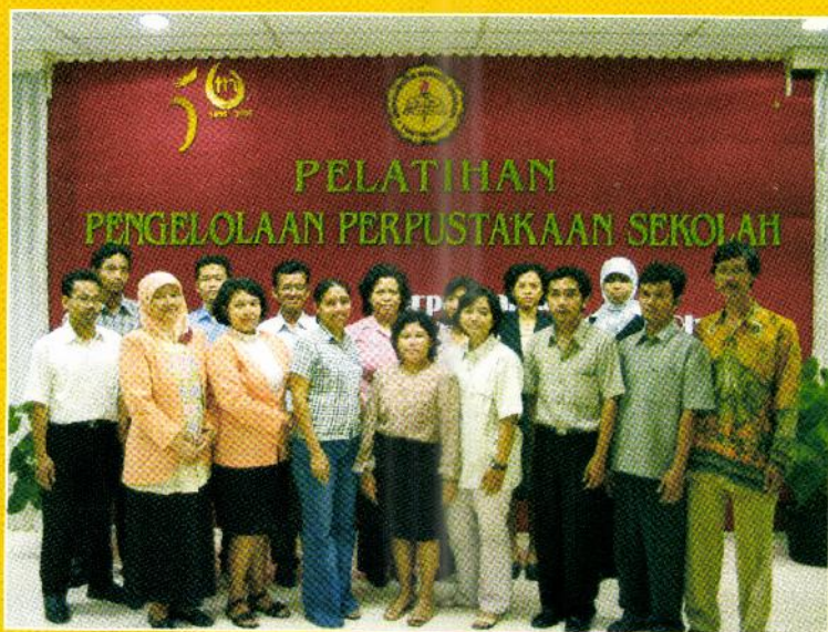
Para peserta Pelatihan Pengelolaan Perpustakaan Sekolah, Juli 2005